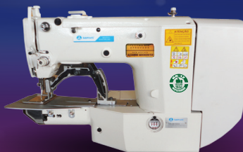
SA-M1904 Travete Eletrônica, Lançadeira Pequena, Area de 60x40mm c/ Painel Touch Screen.