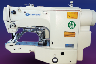
SA-M430G Travete Eletrônica, Lançadeira Pequena, Area 40x30mm.