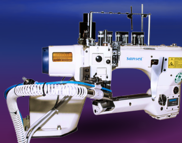
SA-L6288-01MS60D Máquina de braço industrial FLAT SEAMER, 4 Agulhas, 6 fios, com Bitola de 6.0 mm. Sistema com Faca Refiladora.