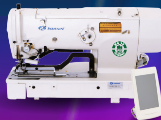
SA-M1790-12 Caseadeira Eletrônica c/ Painel Touch Screen, (Caseado Reto), Tamanho Máximo de 120mm.