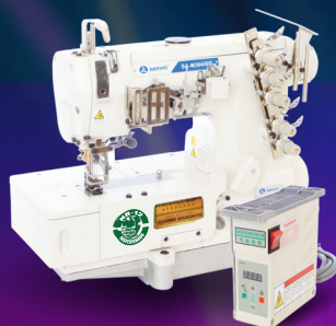
SA-M364/DD Galoneira Direct Drive.