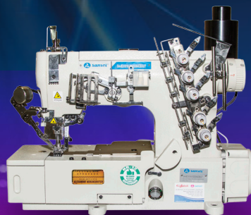
SA-M31016-01DD 364 CBXUT Galoneira Eletrônica Direct Drive, Base Plana c/ Corte de Linha.