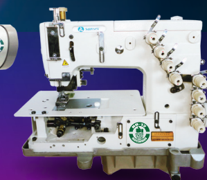
SA-M1503/PTF Fechadeira Base Plana c/ Catraca 3 Agulhas, Bitola de 6,4mm Convencional.