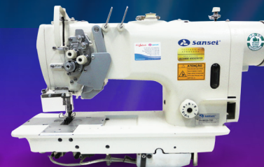
SA-M828-75D Pespontadeira, 2 Agulhas, Barra Alternada Lançadeira Grande, Direct Drive.