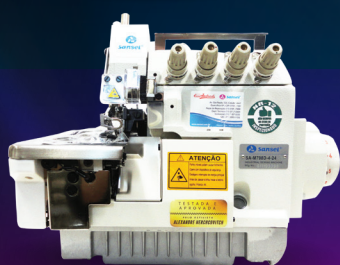
SA-M798D-4-24 Overlock ponto cadeia, Direct Drive, 4 fios.