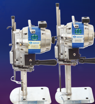
DC-3B Máquinas de Corte Sansei 550W - 8" e 10". 750W - 8" e 10".

Testada e aprovada pelo estilista ALEXANDRE HERCHCOVITCH