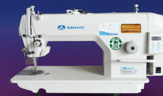
SA-M598DD Costura Reta c/ Motor Posicionador Direct Drive.